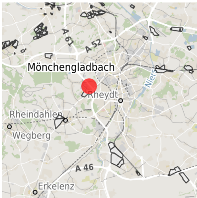
Lage in der Kommune