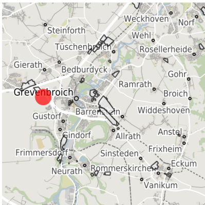
Lage in der Kommune