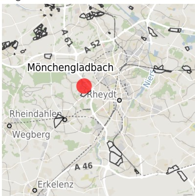
Lage in der Kommune