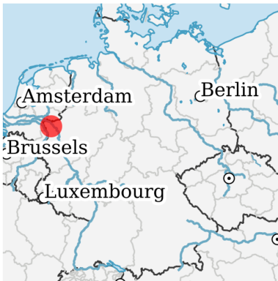
Lage in Deutschland