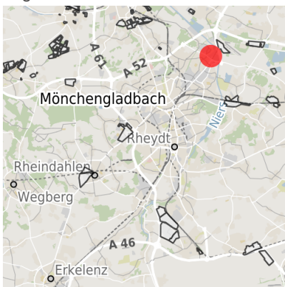
Lage in der Kommune