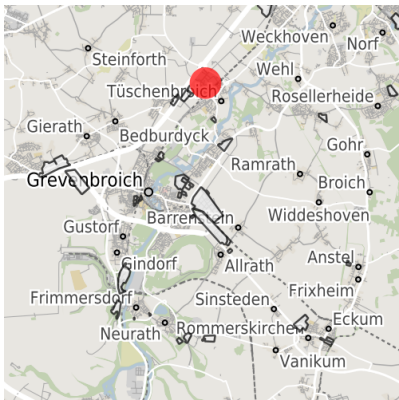
Lage in der Kommune