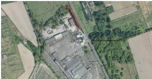
Gewerbegrundstück Düsseldorfer Str. 87