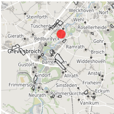
Lage in der Kommune