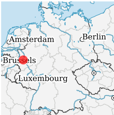
Lage in Deutschland