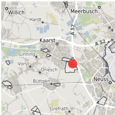
Lage in der Kommune